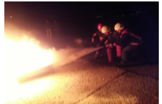
Burgazada Temel Yangın Söndürme Pratik Dersi

İstanbul Burgazada- Heybeliada ve Büyükkada`dan sonra MAG eğitimi olarak kendi MAG ekibini kuran üçüncü İstanbul Adası olan Burgazada`da eğitimler 15 Ocak günü başladı. Adalar Belediyesinin ekipmanları sağladığı uygulamada Burgazada sakinleri olası bir afette korunma ve müdahale konusunda ilk 72 saatte yapabileceklerini tatbik ederek öğrendiler.