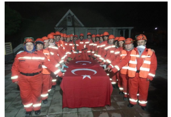
Selimpaşa Yemin Töreni

İstanbul Silivri- Silivri Belediyesi`nin sağladığı konteyner ve ekipman katkısıyla gerçekleştirdiğimiz Selimpaşa mahallesi MAG uygulamasında eğitimler 04 Aralık`da başladı ve 13 Ocak Pazar günü pratik eğitimle tamamlandı. Eğitim sonrası kısa süren kış gününün akşama dönmesi ile Selimpaşa mahallelileri yeminlerini Bakırköy Sivil Savunma alanı bahçesinde akşam karanlığında yaptılar. Fenerlerle aydınlatılan alanda Selimpaşa MAG`larının yüksek sesle yaptığı yemin izlenmeye değerdi.