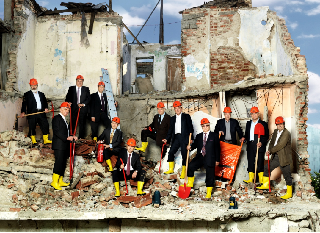
MAG Vakfı kurucularının katıldığı fotoğraf çekimi Şişli Fulya mahallesinde gerçekleştirildi. Fotoğraf çekiminde Şişli Belediyesi'nin desteğiyle düzenlenen enkaz alanı kullanıldı.

Mahalle Afet Gönüllüleri Vakfı'nın (MAG Vakfı), deprem konusundaki farkındalığı artırmak üzere gerçekleştirdiği çalışmalar kapsamında, iş dünyasının önde gelen 12 ismi, ünlü fotoğraf sanatçısı Tamer Yılmaz'ın gerçekleştirdiği fotoğraf çekimi için kadraja girdi.