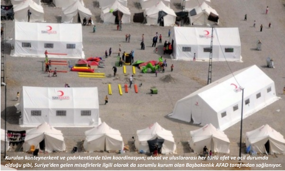
Kurulan konteynerkent ve çadırkentlerde tüm koordinasyon; ulusal ve uluslararası her türlü afet ve acil durumda olduğu gibi, Suriye'den gelen misafirlerle ilgili olarak da sorumlu kurum olan Başbakanlık AFAD tarafından sağlanıyor.

Suriye'de başlayan iç karışıklıklar nedeniyle, nüfus hareketlerine yönelik olarak bugüne kadar ülkemize gelen 160 binden fazla Suriye vatandaşı için, Başbakanlık AFAD tarafından 7 ilimizde kurulan kamplarda bir yılı aşkın süredir her türlü insani yardım ihtiyacı karşılanıyor.