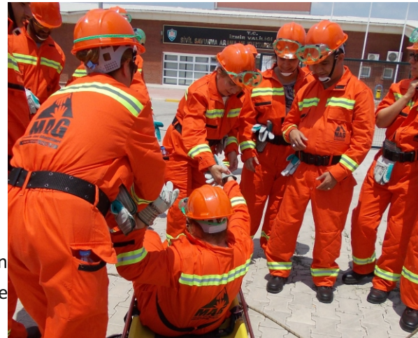
Narlıdere A ekibi eğitimlerini geçen yaz yaptı. A ekibinin de yoğun çalışması sonucu Narlıdere ilçesinde ikinci ekibin eğitimleri başlamış oldu.

MAG Vakfı tarafından İzmir Narlıdere Belediyesi ile yürütülen proje çerçevesinde Narlıdere ilçesinde 2. etap MAG uygulamasına başlandı. Geçtiğimiz yaz başında yapılan çalışma ile Narlıdere'de 40 kişilik bir Mahalle Afet Gönüllüleri grubu oluşturulmuştu. Ekiplerin eğitimleri MAG Vakfı'nın organizasyonunda profesyonel eğitmenler tarafından verilmişti. Narlıdere Belediyesi ve MAG Vakfı arasında imzalanan protokol uyarınca oluşturulan MAG ekiplerinin ekipman ve bu ekipmanların kullanımına ait eğitim masrafları Narlıdere Belediyesi tarafından temin ediliyor. Narlıdere 2. etap uygulamasının yıl sonundan önce tamamlanması planlanıyor. Protokol çerçevesinde 2013 yılında 3. etap uygulaması yapılacak.